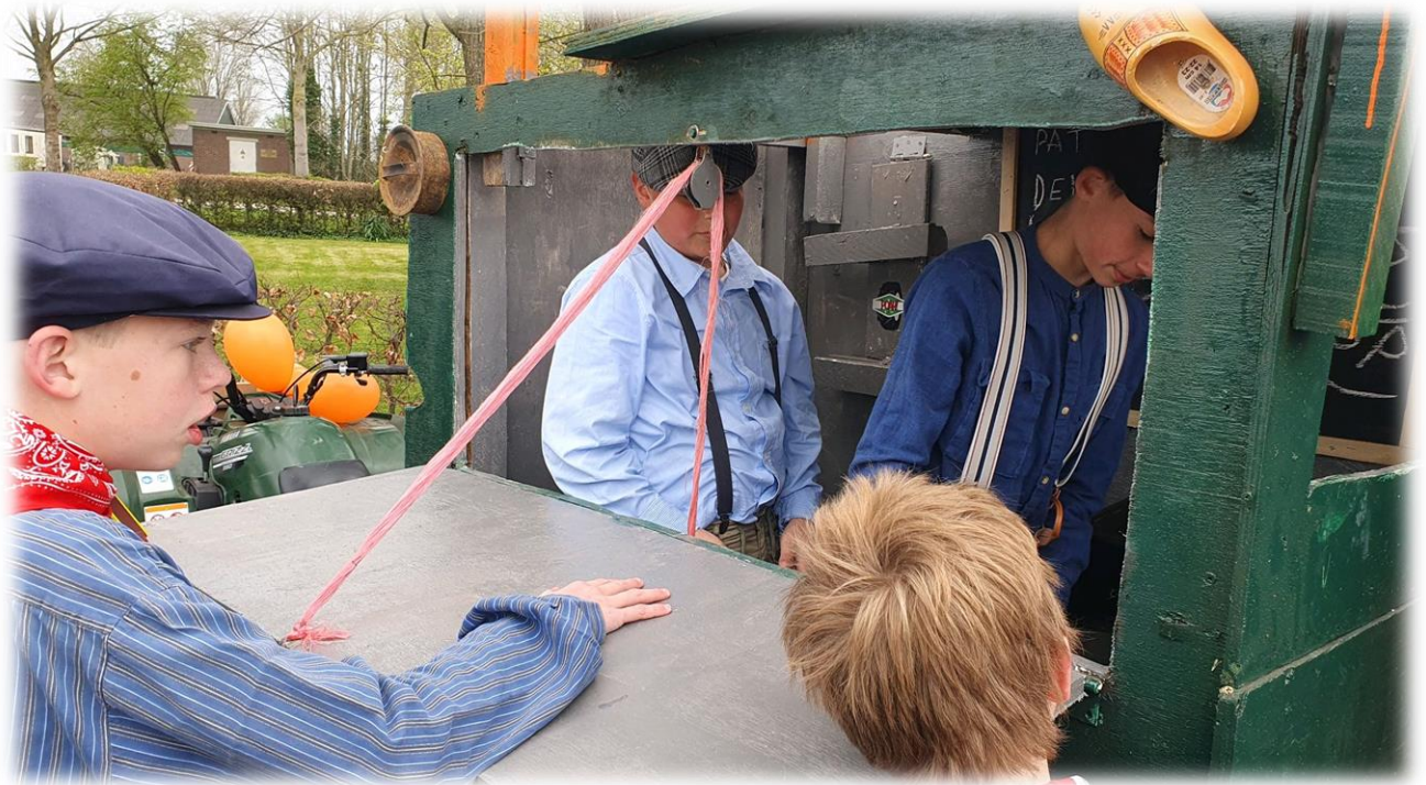
100-jarig bestaan 2023